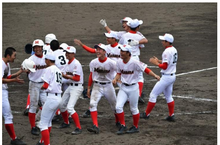
↑ 2019/7/21 ベスト8進出の瞬間