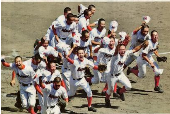
↑ 2015/7/26 中日新聞より