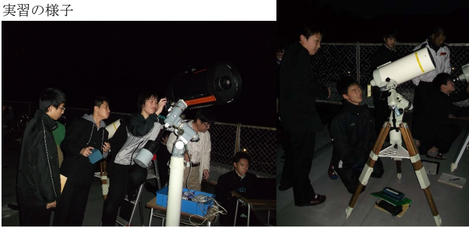
屋上での実習風景 (左: C11、右: \mu 180 で土星や火星を観察)