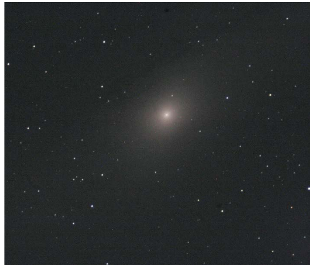
M31 (アンドロメダ大星雲)