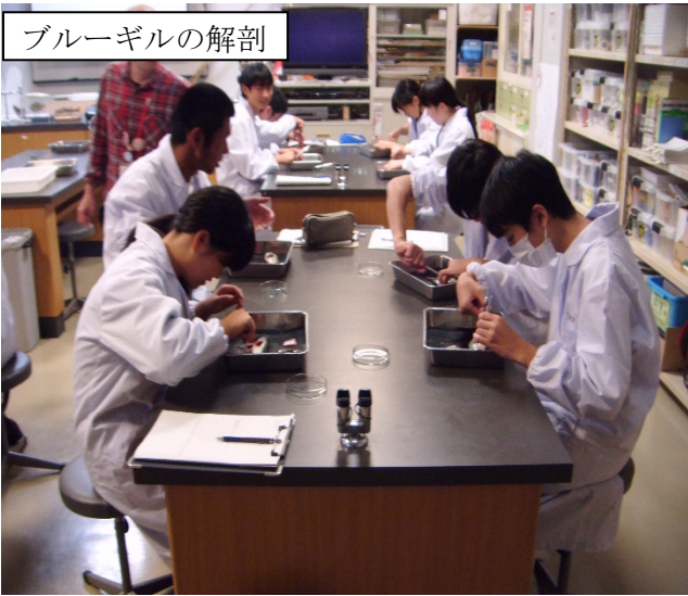
ブルーギルの解剖