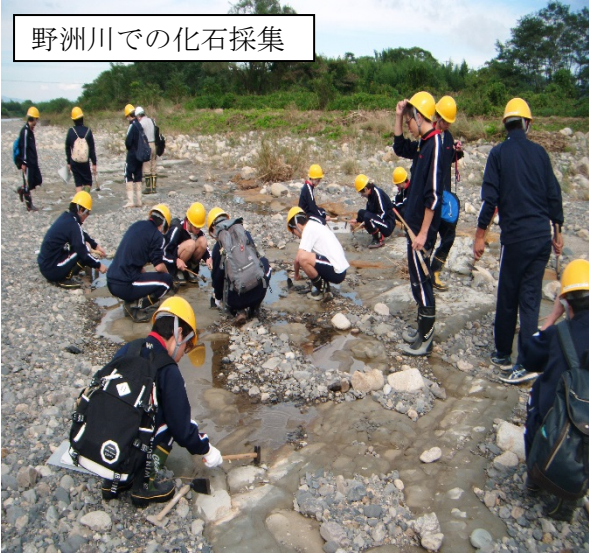
野洲川での化石採集