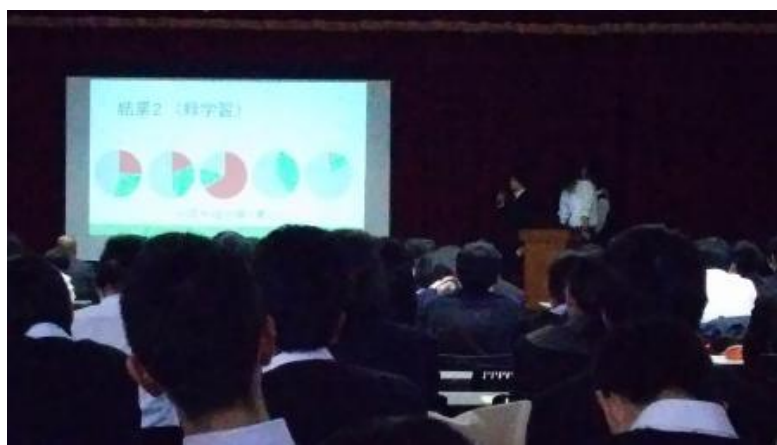
春季大会での口頭発表の様子